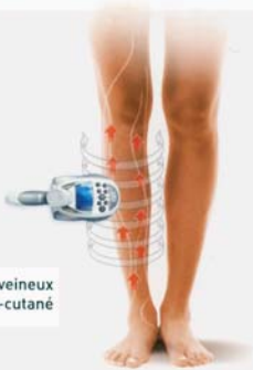
Le réseau veineux sous-cutané